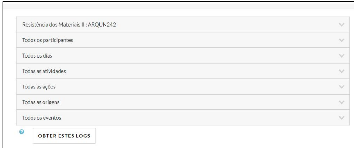
Figura 4 - opções de Logs

Logs: Este tipo de relatório permite obter dados de um participante ou de todos inscritos na disciplina (inclusive o professor). Os dados referem-se a recursos e atividades.